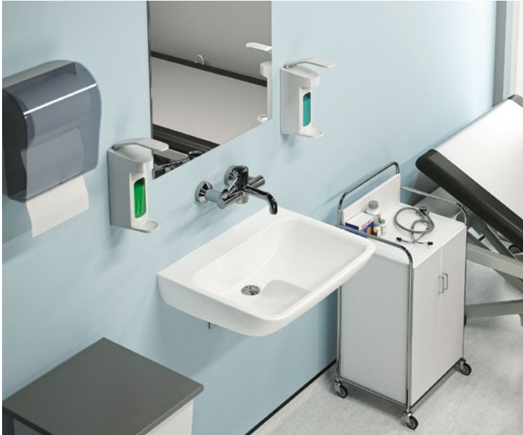
Equipos antibacterias y para la prevención de infecciones de Ideal Standard.