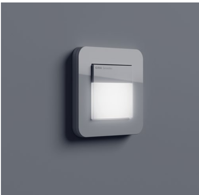
Detector de presencia e interruptor de luz de Gira.

Entre las innovaciones sugeridas a las empresas para los baños de sus locales figuran cubículos que se limpian a sí mismos, salidas que no requieren contacto humano, personal de asistencia y más grifos con sensores. Según los expertos, se mejora la higiene al minimizar la exposición a superficies que podrían estar infectadas y se aumenta la confianza del público en la limpieza de las instalaciones.