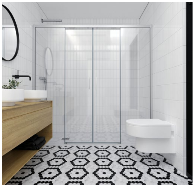
Espacios higienizados mediante mamparas de Profiltek.