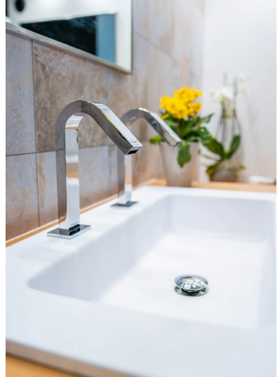
All in one by Mediclinics.