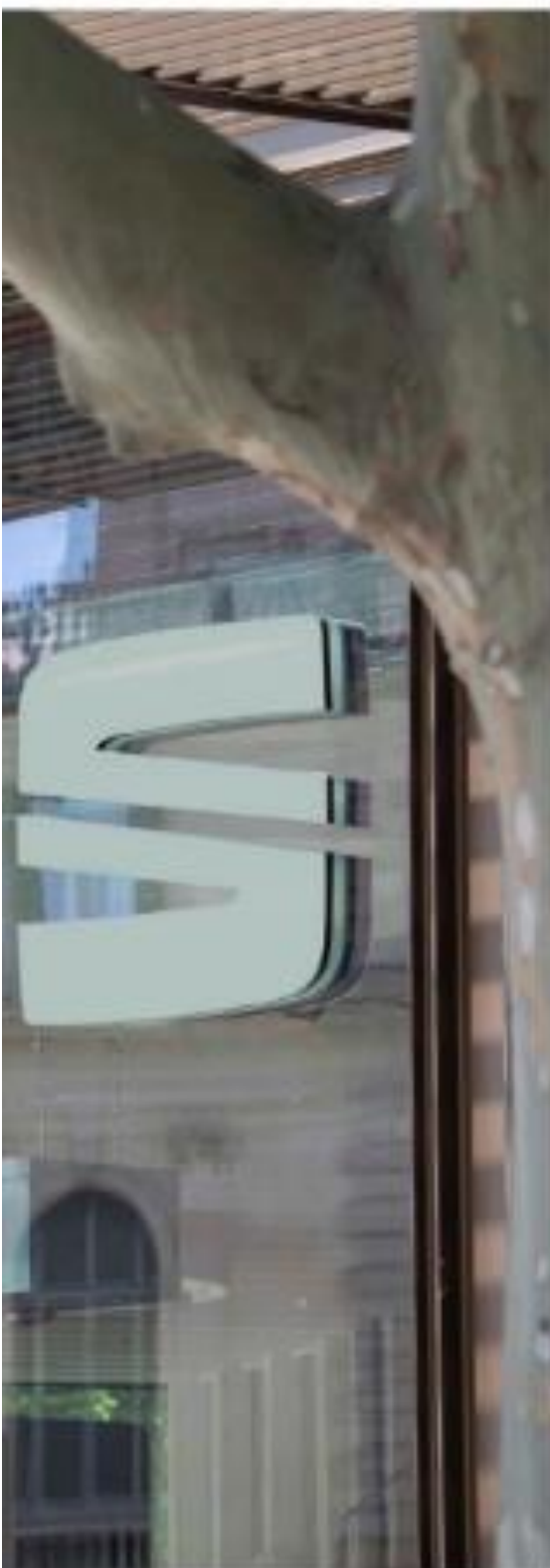
Casa SEAT de Barcelona, obra de Carlos Ferrater.