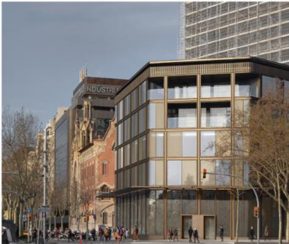
El edificio está situado en la avenida Diagonal con Passeig de Gràcia, como un espacio estratégico y dinamizador que permite ahondar en el futuro de la movilidad.

El 'hub' pretende ser un espacio multidisciplinar que reúne un espacio gastronómico de calidad y que está inspirado en la cultura urbana de la ciudad para ofrecer un 'punto de encuentro', un lugar de intercambio de ideas creatividad y negocio, además de un espacio que acoge a medios de comunicación e instituciones.