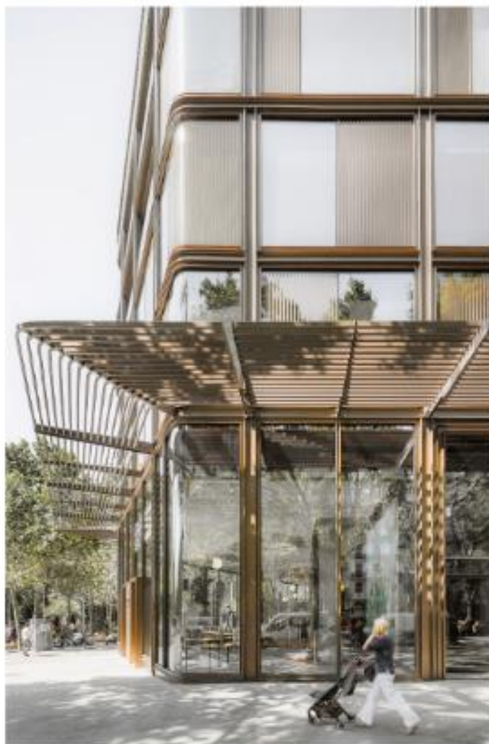
Fachada exterior del edificio con grandes vitrales.

Las fachadas que albergan escaleras, cuerpos de servicio y galerías de instalaciones se tratan con celosías de elementos broncíneos verticales.