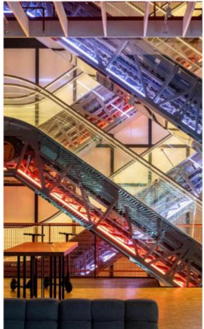
Detalles del interior de Casa SEAT.

Así, el nuevo proyecto construye un pasaje peatonal, un espacio urbano que articula una propuesta compleja a la vez que diferencia los nuevos usos y ofrece a la ciudad en uno de sus lugares más emblemáticos y centrales, un proyecto permeable y contemporáneo.