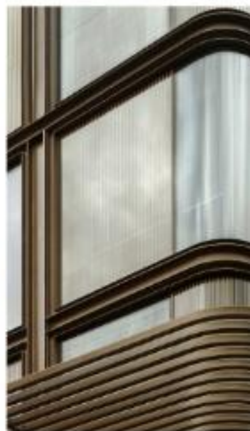
La rampa para a fin de obra se aloja en el volumen del vestíbulo.

Un segundo pasaje de servicios, posterior en su encuentro con los edificios colindantes del Paseo de Gracia, solucionará los temas de evacuación de los núcleos verticales, los espacios de servicio y las plantas bajo rasante. El desarrollo de aparcamiento subterráneo se produce desde la Plaza de San Miguel mediante dos montacargas.