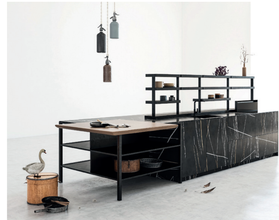
Una elegante cocina con material marmolizado negro de Rekker.

Los colores neutros derivan hacia tonos más atrevidos y vibrantes