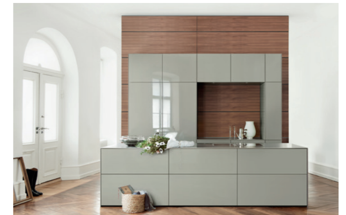
Sistema de mobiliario b3, un modelo esencial de la firma Bulthaup.

son parte esencial del diseño. Las piezas elegantes e independientes, como las cómodas, vitrinas y estanterías de madera sustituyen conceptos integrados estándar y brindan flexibilidad a la cocina.