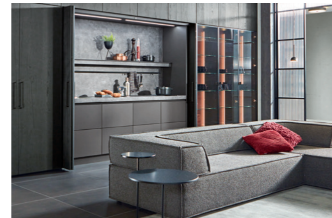
Roca propone cocinas que se integran en el salón.