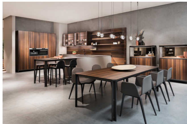
La madera vetada entra con fuerza. Serie D12 en madera eucalipto de Dica.