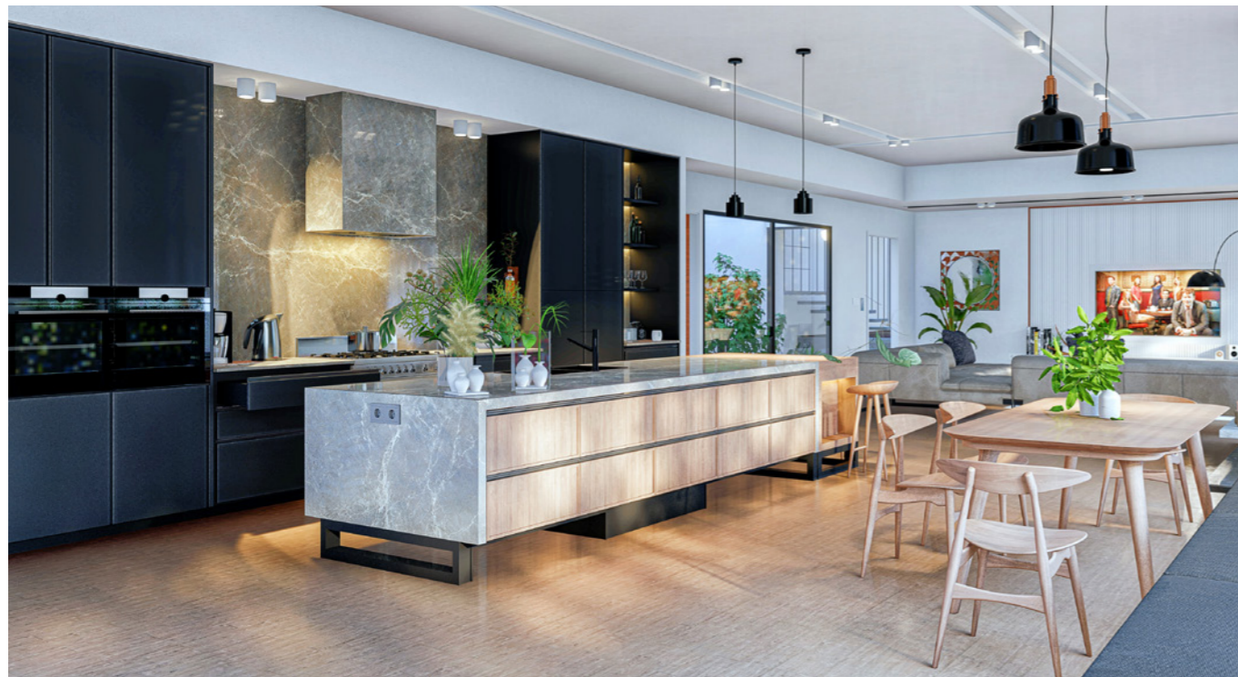
Cocina ecológica, verde y con texturas.