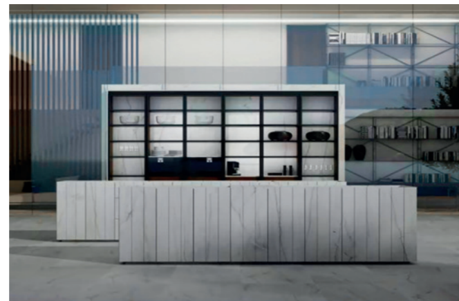
La elegancia protagonista del modelo Luxury Stone de Doca.

Los colores neutros derivan hacia tonos más atrevidos y vibrantes