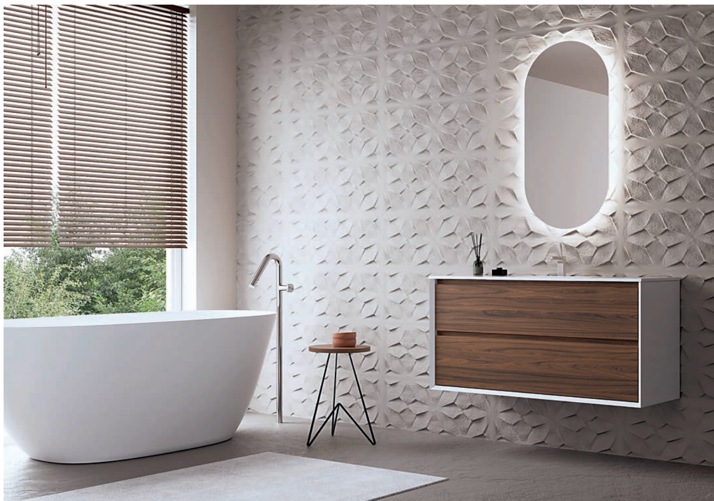
Conjunto "Cool" Blanco y Nogat de NOFER. www.nofer.com