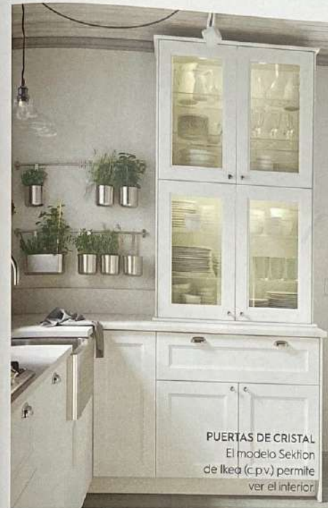
PUERTAS DE CRISTAL El modelo Sektion de Ikea (c.p.v.) permite ver el interior.

Cada fabricante te ofrecerá la posibilidad de completar tus cajones con accesorios a medida. Existe una gran variedad de separadores y elevan el precio, pero lo mejor es adquirirlos con ellos. Cubertero. Añade una bandeja compartimentada o separaciones fijas. Gavetero. Para menaje bastan separadores estrechos y altos.