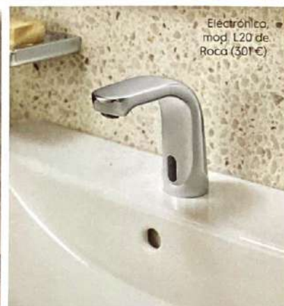
Electrónico, mod. L20 de Roca (301 €).