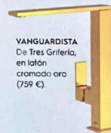
VANGUARDISTA De Tres Grifería, en latón cromado oro (759 €).