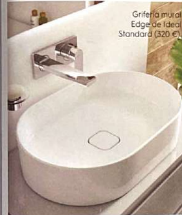
Grifería mural Edge de Ideal Standard (320 €).