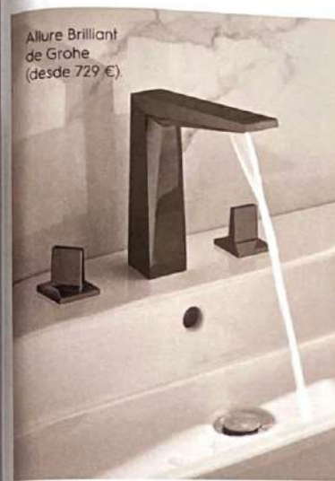
Allure Brilliant de Grohe (desde 729 €).