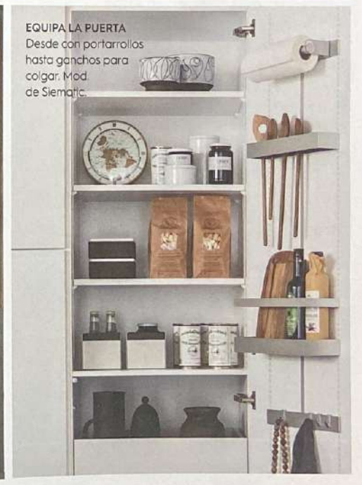
EQUIPA LA PUERTA Desde con portarrollos hasta ganchos para colgar. Mod. de Siematic.