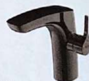
LOOK MODERNO Modelo Insignia Black de Roca (355 €).