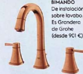
BIMANDO De instalación sobre lavabo. Es Grandera de Grohe (desde 901 €).