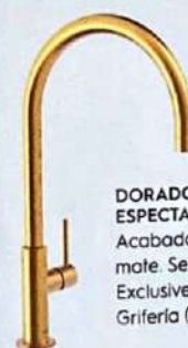
DORADO ESPECTACULAR Acabado en oro mate. Serie Study Exclusive de Tres Grifería (425 €).