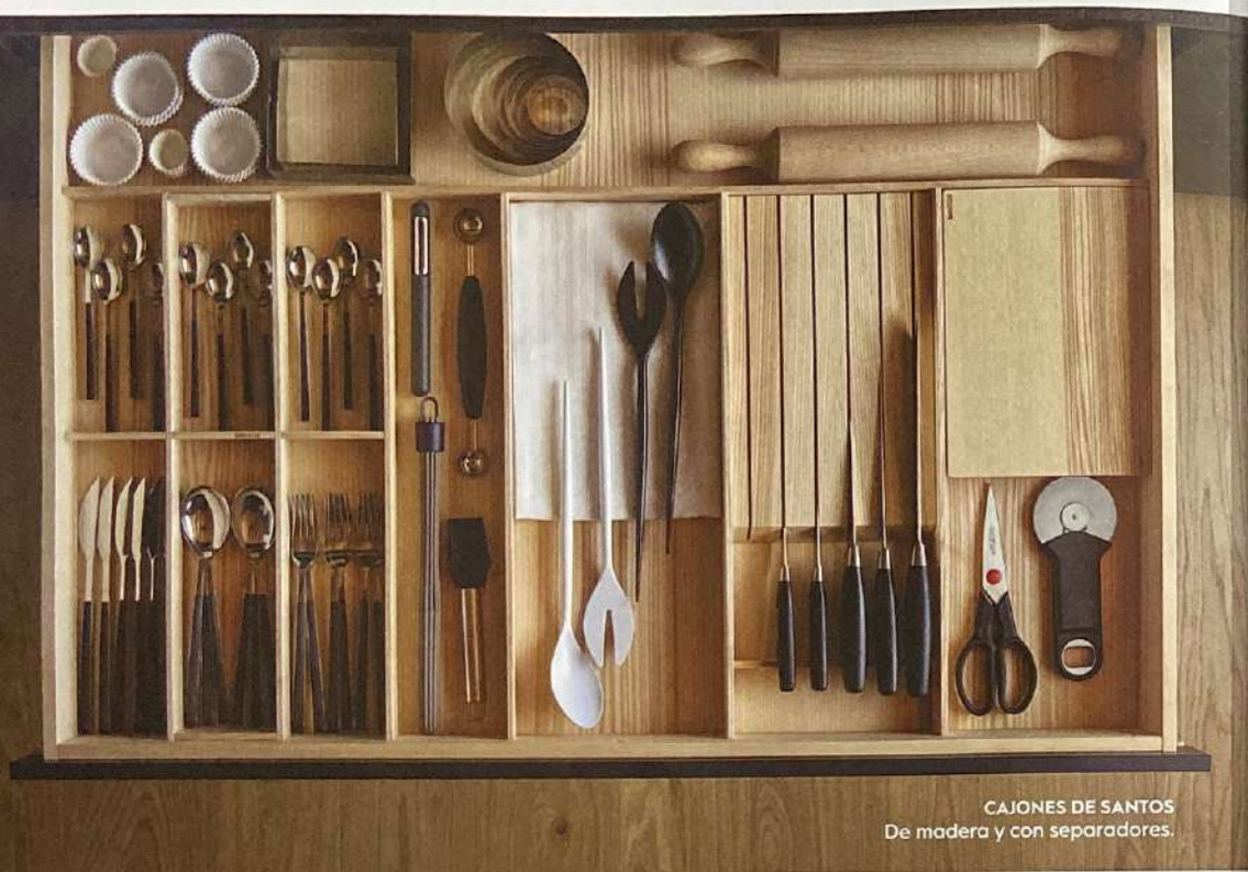
CAJONES DE SANTOS De madera y con separadores.