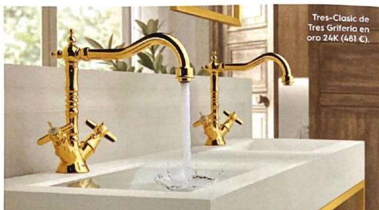
Tres-Clasic de Tres Grifería en oro 24K (481 €).

¿Elijo bimanando o monomando? La ventaja de estos últimos es que se manejan con una mano y mayor comodidad. En el mercado encontrarás incluso mandos electrónicos, que se activan con un sensor de infrarrojos, por lo que el agua cae al pasar las manos delante. Son más higiénicas.