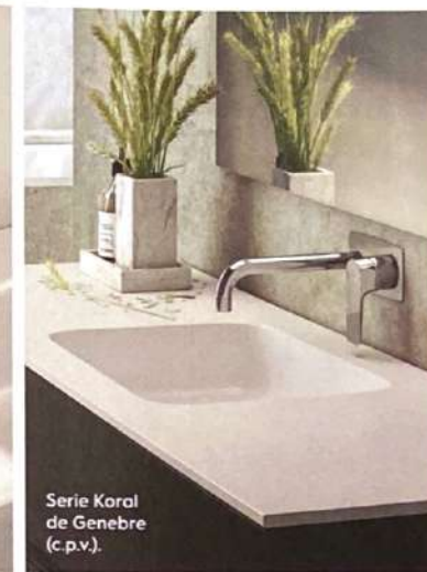
Serie Koral de Genebre (c.p.v.).