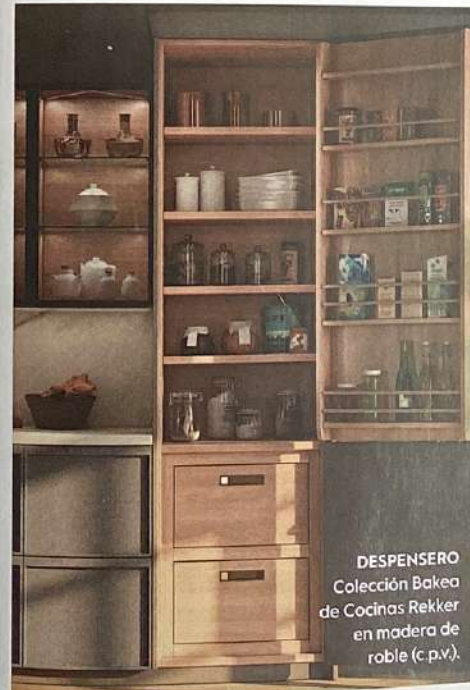
DEPENSAERO Colección Bakea de Cocinas Rekker en madera de roble (c.p.v.).