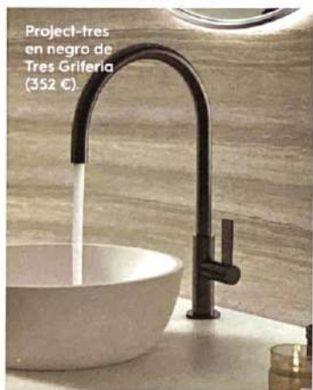
Project-fres en negro de Tres Grifería (352 €).