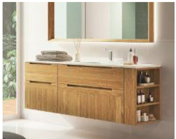
GRAN CAPACIDAD Mueble de la serie Catania de Grupo Seys. De pino, a medida, con 4 cajones y 3 baldas. C.p.v.