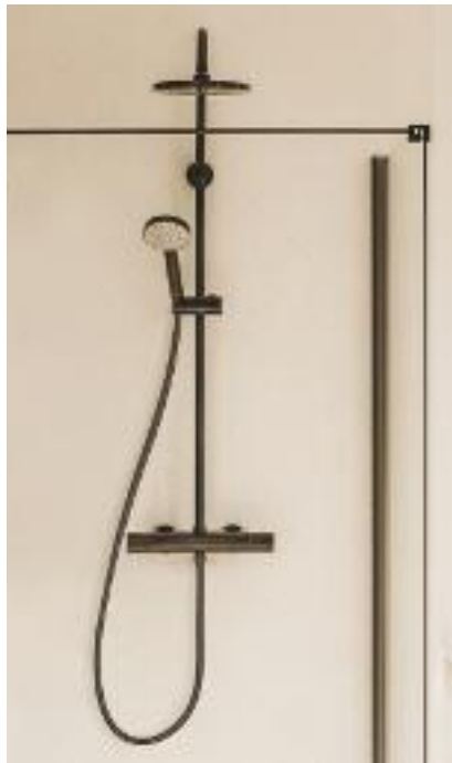
EN 4 ACABADOS Columna termostática Everlux Even de Roca. Con ducha de mano multifunción y rociador de gran tamaño con versión redonda y rectangular. Desde 558 €.