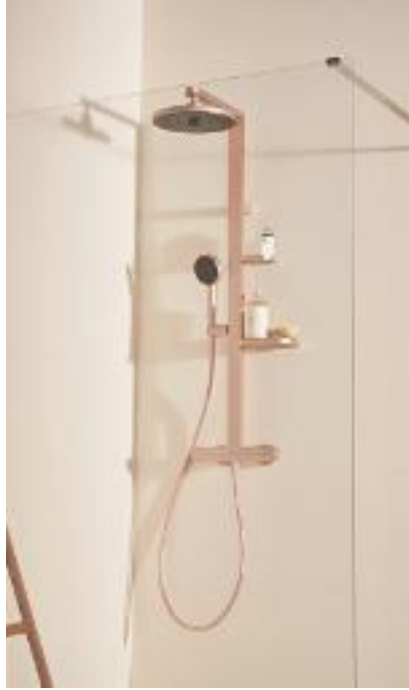
TERMOSTÁTICA Y EN ROSÉ Columna Alu+ de Ideal Standard con dos bandejas regulables en altura y pulsador Eko para reducir el caudal un 50%. En 3 acabados, vale unos 445 €.