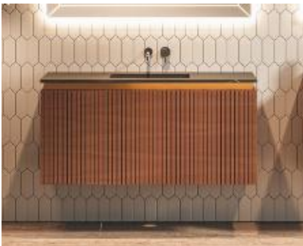
A MEDIDA Y LOOK NOGAL Colección Olympia de Decosan con frentes de palillera, unos 1.011 € (100 cm de ancho).