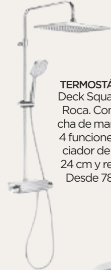
TERMOSTÁTICA Deck Square de Roca. Con ducha de mano de 4 funciones, rociador de 36 x 24 cm y repisa. Desde 785 €.