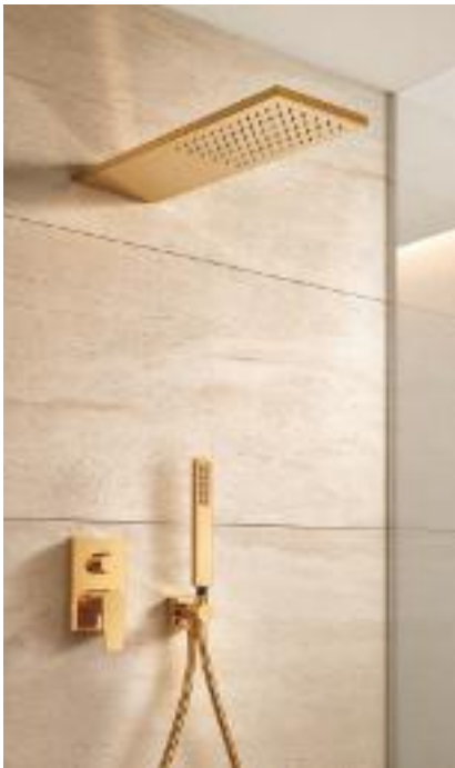
EMPOTRADA Y EN OROMATE Elegante y estilosa, se llama Project-Tres y es de Tres Grifería. Con ducha de mano anticalcárea, rociador de 16 x 55 cm y en 10 acabados. Vale 1.737 €.