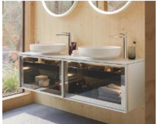
ACRISTALADO Semitransparente y retroiluminado, y con estructura de metal (160 x 42 cm). Vitrium de Duravit (c.p.v.).