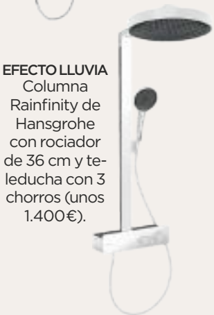
EFEECTO LLUVIA Columna Rainfinity de Hansgrohe con rociador de 36 cm y teleducha con 3 chorros (unos 1.400 €).