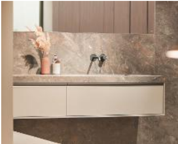
MODULAR Composición D12 de Dica con laca en acabado Alondra. Disponible también en madera. C.p.v.