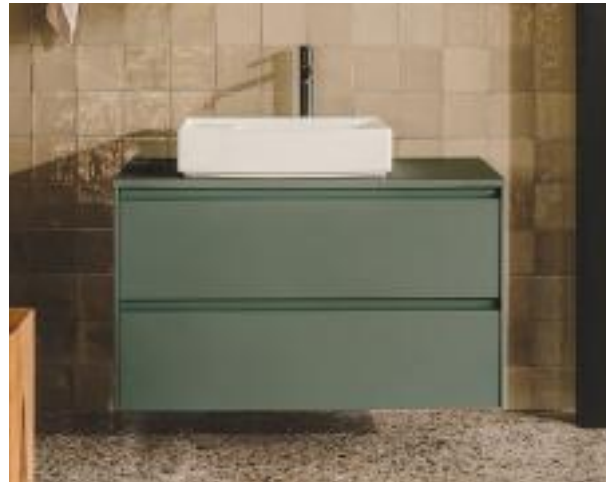
LACADO EN VERDE Mueble Ona de Roca ligero y capaz. Con uno o dos cajones, desde 1.400 € (80 x 46 x 64 cm).