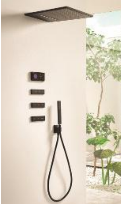
ELECTRÓNICA Y CON HIDROMASAJE Conjunto de ducha de Tres Grifería con control termostático electrónico, 3 jets empotrados de hidromasaje y rociador de mano con 2 chorros (1.737 €).