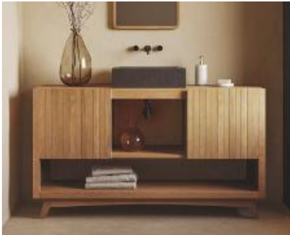
DETECA Y ALISTONADO Mueble Kuveni de Kave Home con armarios, estante y hornacina (140 x 50 x 80 cm): 1.099 €.