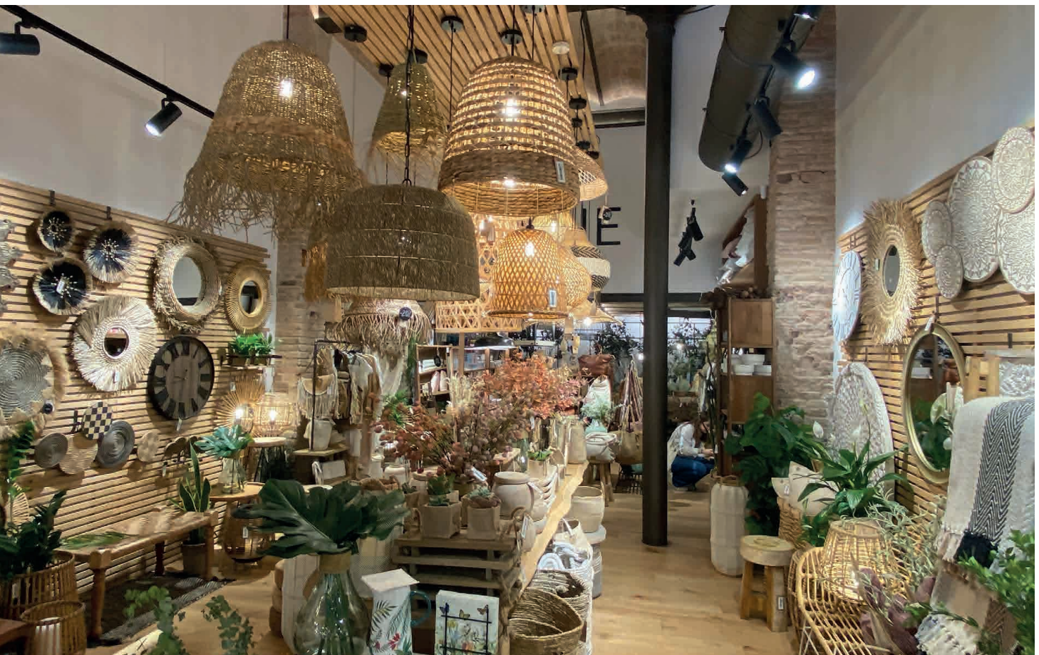
Interior del showroom de Vivie en Barcelona, con una amplia oferta de soluciones basadas en la artesanía y materiales orgánicos.

“Estamos sorprendidos del rápido crecimiento de la compañía. Hemos superado las expectativas y, muy especialmente, hemos conseguido fidelizar con nuestros clientes que es lo más