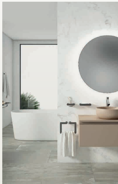
Ambientes de la colección Verona en negro y Capri, en dorado.

Corinto juega con las sutiles formas de su diseño para elevar cada una de las piezas a un estatus de exclusividad sin igual, sin descuidar la funcionalidad y resistencia. Fabricada en acero inoxidable AISI 304, y disponible en tres acabados: oro satinado, cromado y negro.