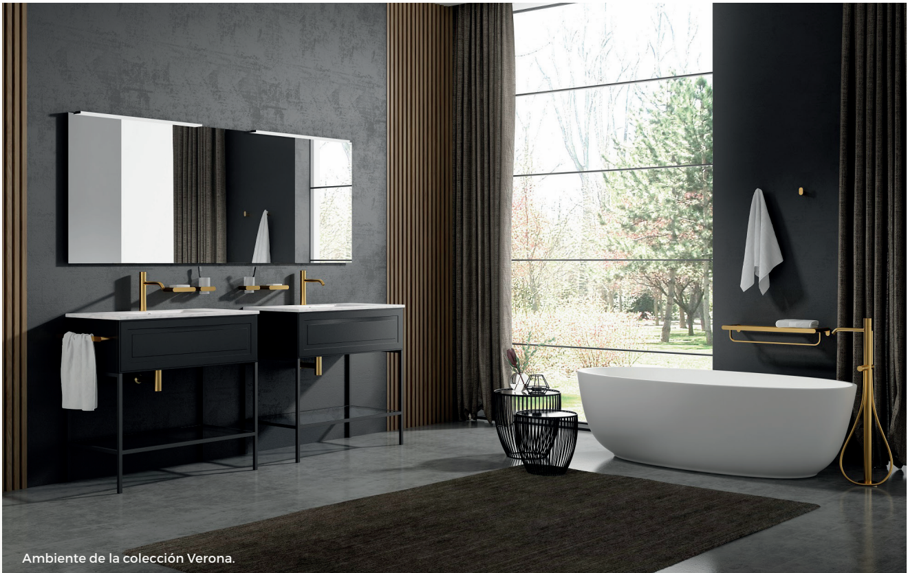
Ambiente de la colección Verona.