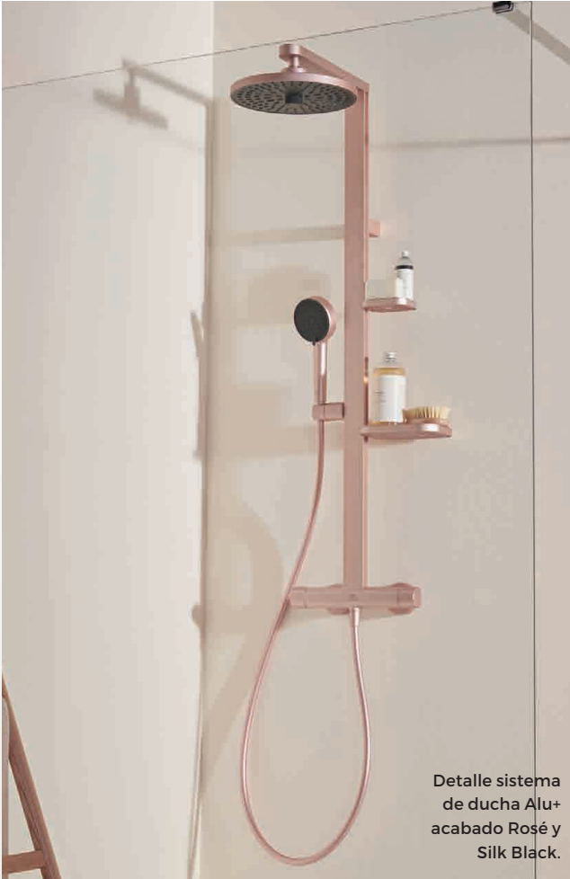
Detalle sistema de ducha Alu+ acabado Rosé y Silk Black.