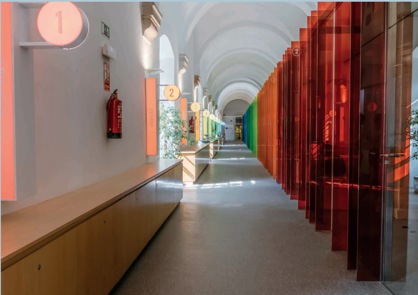
Instantánea del Convento de San Agustín, nueva sede de Barcelona Activa, que mantiene su estructura original, pero con las señas de identidad de 118 Studio, en este espacio de encuentro social y que genera comunidad.

Desde el 2020 empezamos a incursionamos en el sector de oficinas e iniciamos relación con nuestro cliente principal hasta la fecha, Barcelona Activa, con el que hemos participado en varios proyectos con ellos, uno de los cuales fue para la actualización de su sede en el Convento de Sant Agustí, ubicado en el centro de Barcelona. El Convento data del S.XIV, por lo que es un edificio histórico, protegido por el Patrimonio de Barcelona y como tal, debe ser respetado y sufrir las menos alteraciones. Sin embargo, como muchos espacios que llevan existiendo desde hace siglos, debe adaptarse para sus