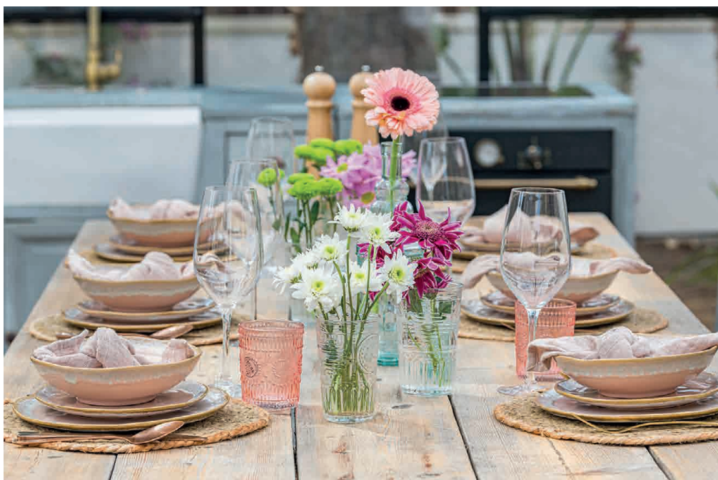
Vestir las mesas en verano con la colección Host de Vivie es una apuesta de estilo y vitalidad, como el romántico modelo Amelia.

Sin duda, un buen envoltorio siempre ayuda a estimular los sentidos, y la elección de una platería sofisticada a la vez que informal es fundamental. Entre las distintas piezas que componen la serie Host de esta temporada se