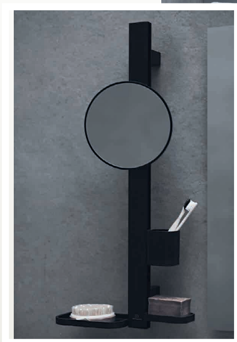
Detalle barra de belleza con espejo y almacenamiento Alu+ acabado Silk Black.

Alu+, ya que todos los embalajes son completamente reciclables y no contienen plásticos de un solo uso.