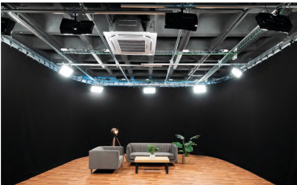
Los motivos cinematográficos están presentes en las estancias de AVISUAL.