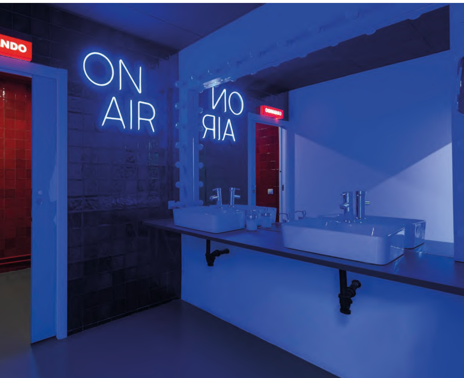
La luminaria 'On Air' atrapa al visitante en su universo de cine.

buscaba crear un lobby impactante y novedoso con un 'efecto WOW'. Para ello, se han proyectado elementos icónicos que hacen referencia al mundo del cine y de la televisión. Destaca el rótulo iluminado con películas de cine. Mientras que en la pared de la recepción, la escena 'On Air' cobra vida en televisores antiguos pintados de azul, aunque uno de ellos actúa como un verdadero monitor que muestra contenido de AVisual, para sumergir al visitante en su fascinante universo creativo.