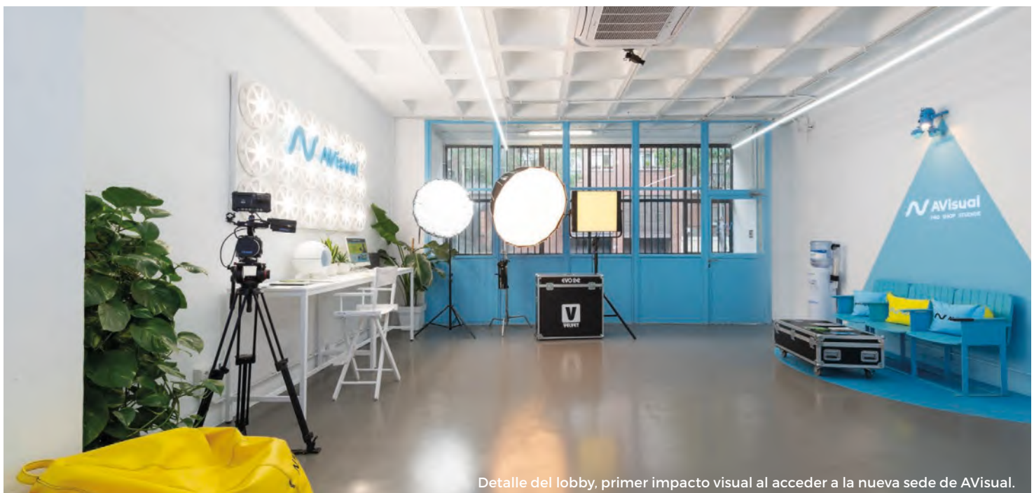
Detalle del lobby, primer impacto visual al acceder a la nueva sede de AVISUAL.

office y la sala U Chroma. Esta última área está equipada con el sistema de insonorización 'Box in Box', una técnica efectiva para crear un entorno aislado acústicamente y llevar a cabo actividades sin interrupciones sonoras.