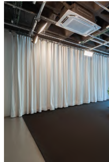
La zona de camerinos y los estudios de grabación y fotografía son otros de los espacios diseñados 'ad hoc' por 118 Studio.

Es la zona donde también se han ubicado los estudios de grabación y fotografía, con el objetivo de maximizar el uso del espacio y permitir una mejor distribución de las áreas técnicas y las zonas comunes.