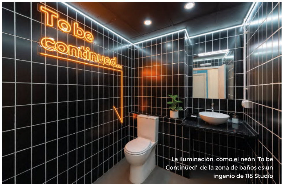
La iluminación, como el neón 'To Be Continued' de la zona de baños es un ingenio de 118 Studio

La señalética y propuesta gráfica son elementos esenciales para guiar a los clientes y visitantes a través de las distintas salas y zonas de servicio, a la vez que refuerzan la identidad de la marca.