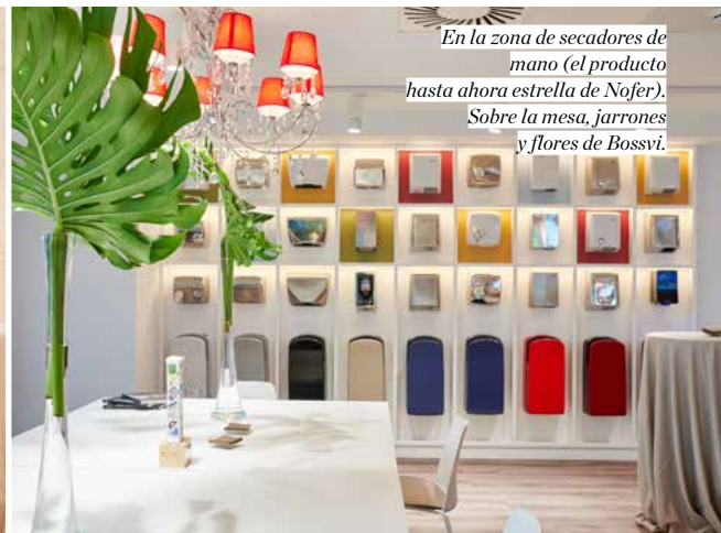
En la zona de secadores de mano (el producto hasta ahora estrella de Nofer). Sobre la mesa, jarrones y flores de Bossvi.