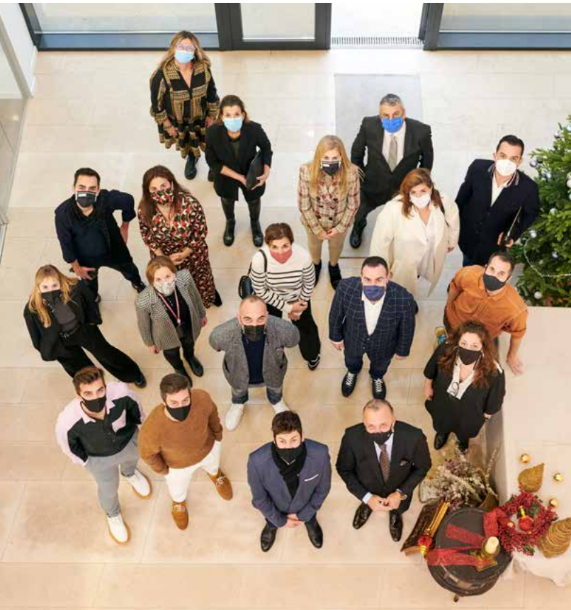
La foto de familia tomada desde la segunda planta de la sede de Nofer, en Sant Feliu de Llobregat (Barcelona).