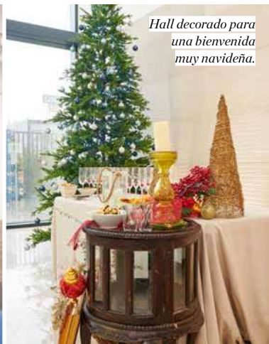
Hall decorado para una bienvenida muy navideña.