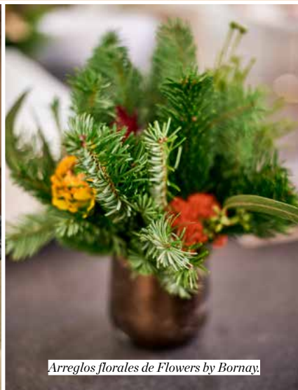
Arreglos florales de Flowers by Bornay.