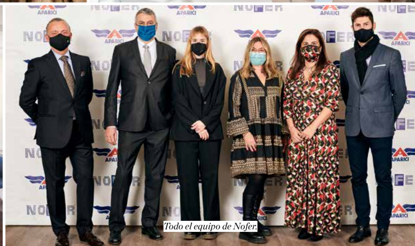
Todo el equipo de Nofer.