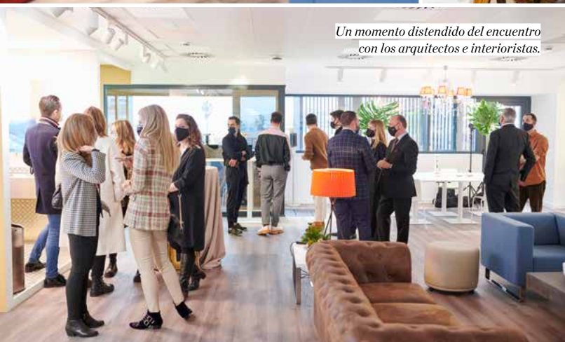
Un momento distendido del encuentro con los arquitectos e interioristas.