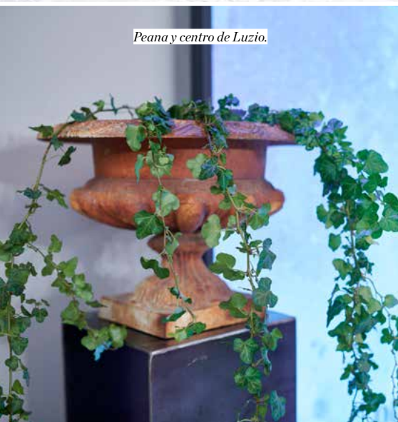
Peana y centro de Luzio.