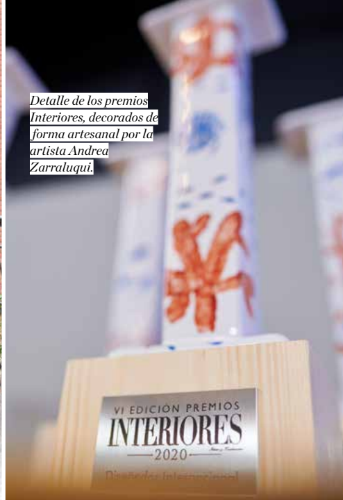
Detalle de los premios Interiores, decorados de forma artesanal por la artista Andrea Zarraluqui.