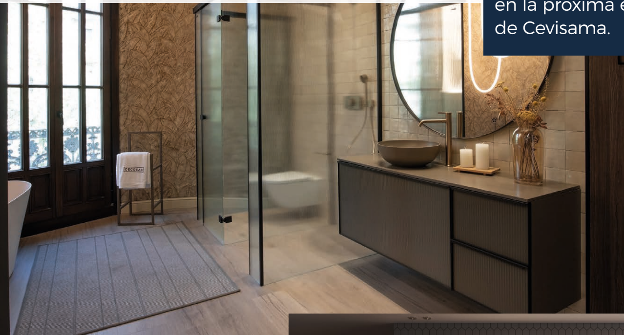
Baño con mueble de la colección Play Glass de Decosan.

Play Glass y Play Ona serán los protagonistas del stand de Decosan en la próxima edición de Cevisama.