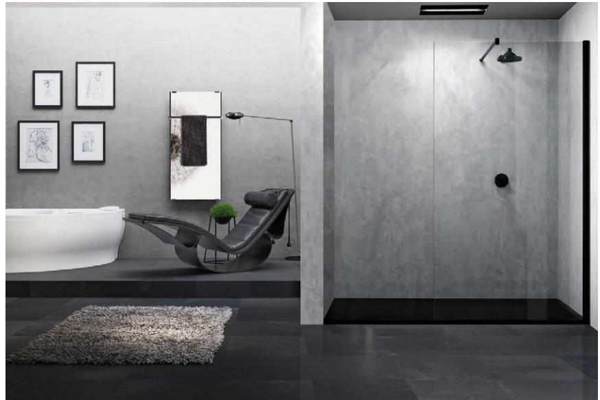
La colección de mamparas Young es extremadamente versátil y personalizable.

La posibilidad de apertura tanto interna como externa añade otra ventaja en relación con la adaptabilidad. Esta característica permite a los usuarios ajustar la configuración de las puertas según sus necesidades y la distribución del espacio, brindando opciones de diseño flexibles y cómodas.