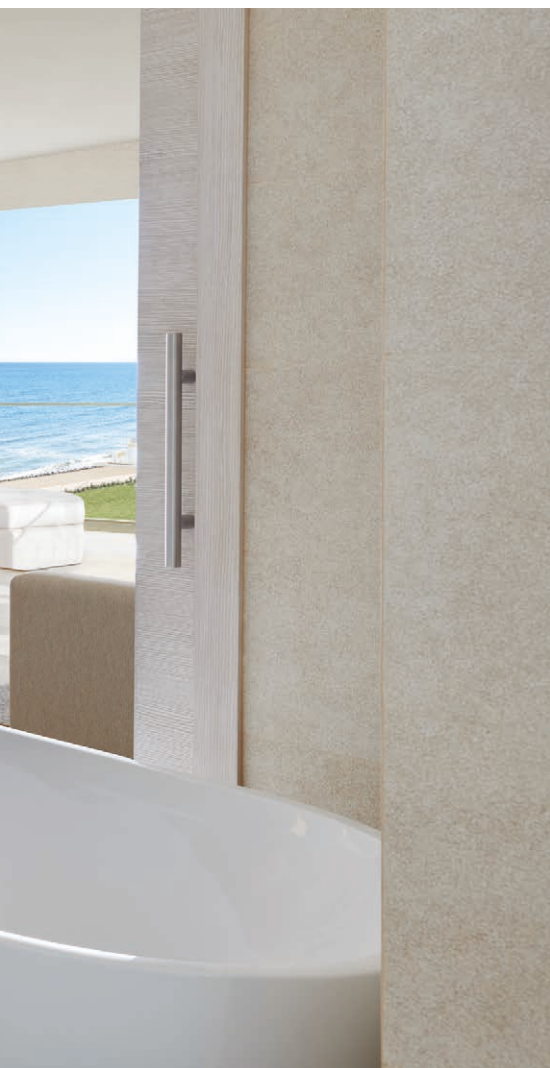
Imagen de una de las suites de este hotel.