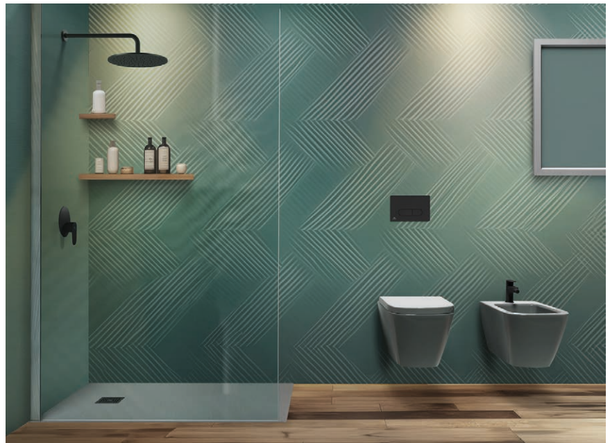
Ambiente UltraFlat S+ acabado gris hormigón de Ideal Standard.

Durante el desarrollo del producto se dio prioridad a la sostenibilidad, y la gama se ha mejorado de acuerdo con los cuatro valores del principio EcoLogic de Ideal Standard: materiales ecológicos y duraderos, fabricación ecológica, menos material, menos impacto y envasado sostenible. Fabricados con el innovador material IdealSolid de Ideal Standard, una combinación de roca dolomítica triturada y un 30% de resina elástica reciclada, mediante un proceso especial de doble moldeado, los últimos UltraFlat S+ se fabrican con un 25% menos de material que sus predecesoras, las UltraFlat S.