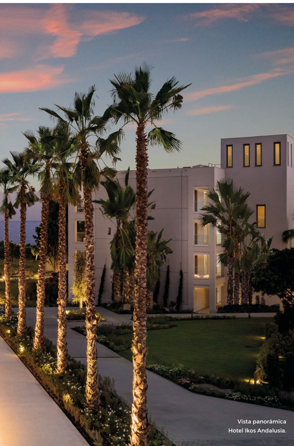
Vista panorámica Hotel Ikos Andalusia.

Ideal Standard, uno de los principales fabricantes mundiales de soluciones para baños y aseos desde hace más de 100 años, ha equipado los baños del Hotel Ikos Andalusia ubicado en Estepona (Málaga). La cadena hotelera Ikos Resorts, especializada en el concepto todo incluido de lujo, ha sido condecorada con numerosos premios de relieve internacional.