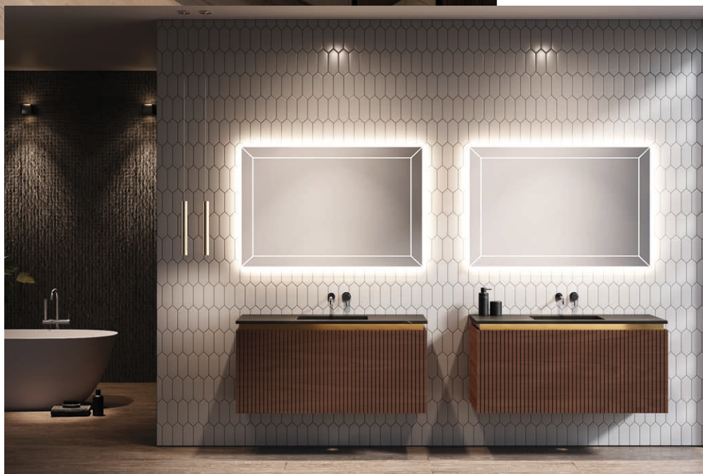
Mobiliario de la colección Olympia de Decosan.

Además, se complementa con un espejo redondo de gran formato retroiluminado que añade estilo y mejora la iluminación, generando un ambiente acogedor y relajante.