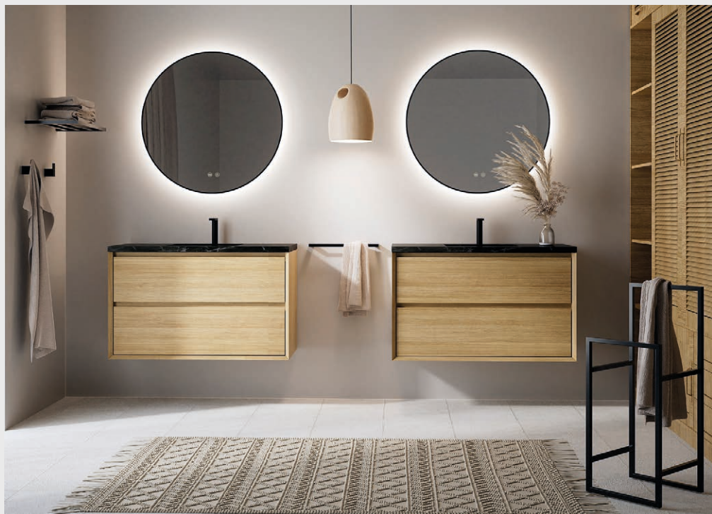
Modelo Cool Mud de la nueva colección F5 de Nofer.

Cevisama volverá a ser el marco elegido por Nofer para presentar sus nuevas y elegantes propuestas de mobiliario. Tras la presentación el pasado año de su primera línea de muebles de baño y el éxito cosechado durante el 2023 con los modelos Reel y Trend –que también estarán presentes en la próxima edición de la feria–, ahora la firma crece en esta línea de negocio gracias a la Colección F5.